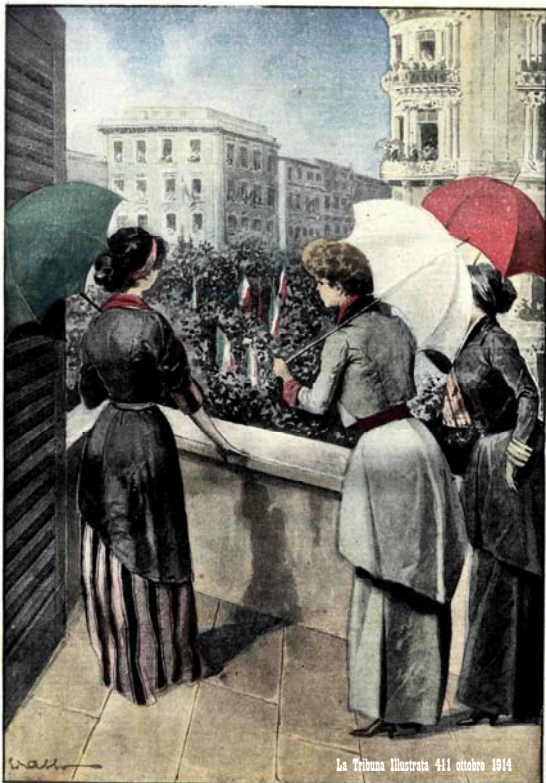
Il XX Settembre. Roma eccita alla maggiore grandezza della Patria: l'episodio dei tre ombrellini formanti la bandiera italiana