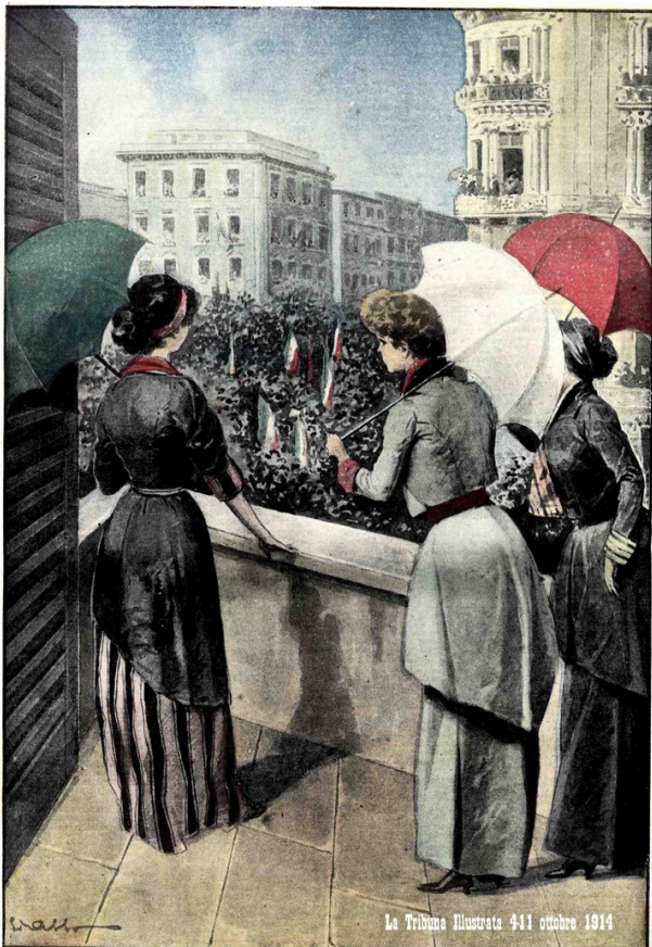
La Tribuna Illustrata 411 ottobre 1914