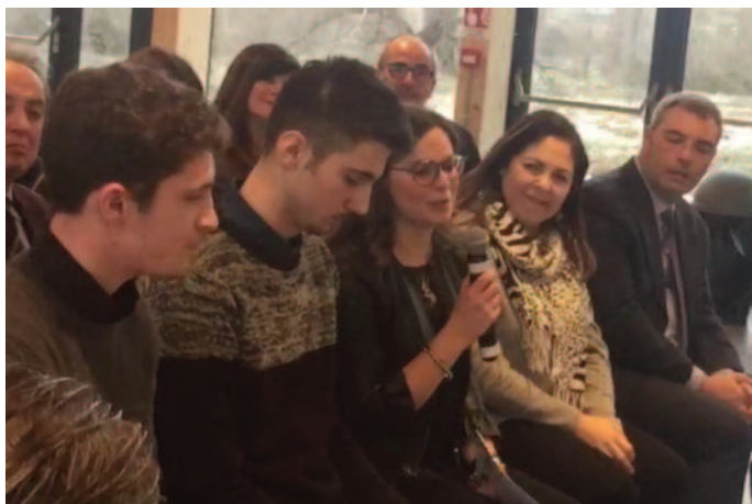
Parlano gli studenti premiati