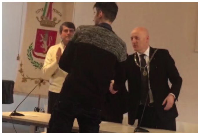
Il Gran Maestro consegna le borse di studio