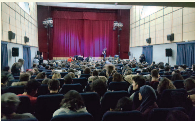
Studenti a lezione di libero pensiero