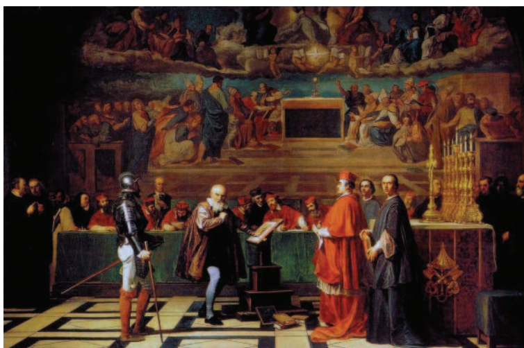
Galileo davanti al Sant'Uffizio (dipinto di Joseph-Nicolas Robert-Fleury)