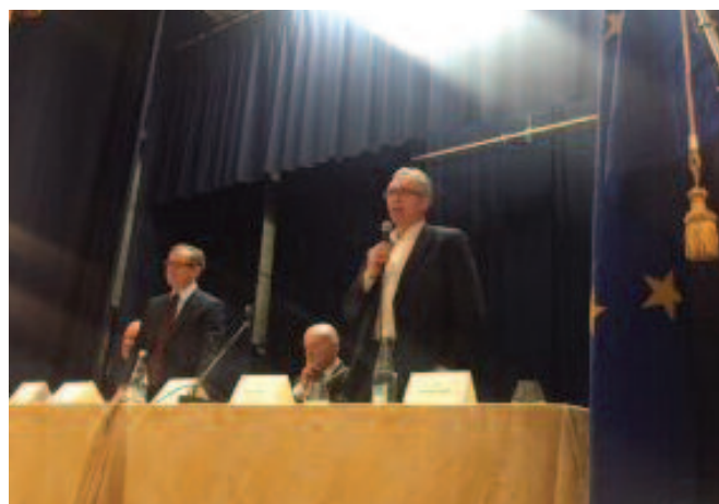
Il presidente della Regione Marche Luca Ceriscioli

situazione particolare. Non è facile studiare mentre la terra trema, con la paura che il tetto sotto il quale vi trovate possa crollare. Voi lo avete fatto, avete continuato a studiare tra una scossa sismica e quella successiva, tra mille gravi problemi e preoccupazioni non solo vostri, della vostra famiglia, ma della comunità intera intorno a voi. Avete avuto coraggio, tanto coraggio. E' per questo che abbiamo chiamato questo premio La Scuola del Coraggio. Voi oggi rappresentate una luce, un faro, su cui investire. Questo piccolo sostegno che vi arriva da noi lo meritate, perché siete riusciti a raggiungere un risultato brillante nonostante la situazione in cui vi trovavate". Bisi ha ricordato l'impegno grande profuso fin da subito a sostegno delle popolazioni terremotate da tutti i fratelli e ha raccontato della richiesta arrivata dai ragazzi di Norcia. Una richiesta che dimostra che quando si è colpiti da gravi tragedia, da cataclismi, oltre che di tende e coperte, c'è bisogno anche di qualcosa che ci faccia tornare il sorriso, la spensieratezza, la gioia di vivere. "Questi ragazzi – ha riferito il Gran Maestro – ci hanno semplicemente chiesto di illuminare un campo di calcio, divenuto