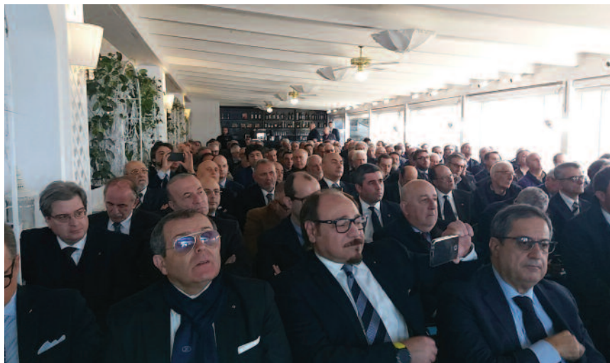
In sala. Sotto, il logo dei 50 anni del Collegio della Sicilia

scello e c'è anche il nostro futuro. Sapremo resistere e continuare ad operare bene come abbiamo fatto finora. Sapremo resistere all'aggressione politico-giudiziaria con la bellezza pulita del nostro fare. E tenendo ben fisso nella nostra mente quel potente e meraviglioso messaggio che ci hanno inviato per Natale i pulcini della squadra di calcio di Norcia e che recita: "Nessun mostro ci potrà disunire perché quando tramonta il sole si accendono poi le stelle".