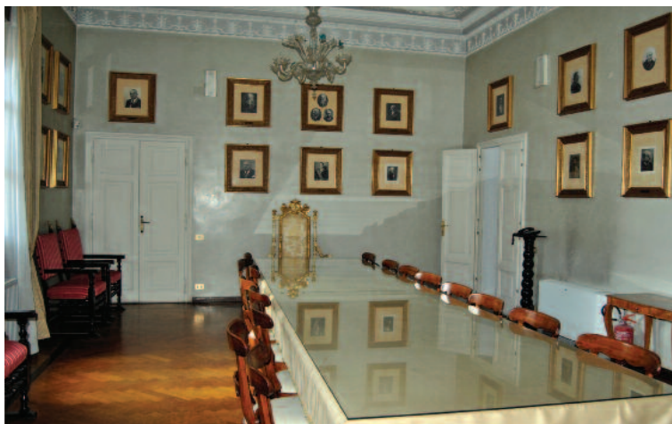
La Sala della Giunta de Il Vascello, dove ci sono i i ritratti dei Gran Maestri

del 2017 sequestrati a quattro comunioni massoniche. Poi andiamo a vedere e si scopre che vengono “conteggiati” fratelli attivi, bussanti, espulsi, sospesi per fare grossi numeri. Provando a scavare tra le pagine della relazione dell’Antimafia si scopre che la Commissione avrebbe accertato che in 27 anni su oltre undicimila iscritti al Grande Oriente d’Italia (inclusi bussanti, espulsi e sospesi), 122 sarebbero rimasti coinvolti, ma non si precisa con quale imputazione. (...) In sei (sempre inclusi bussanti, espulsi e sospesi) sarebbero stati condannati e di questi sei, due sarebbero bussanti da oltre un decennio (cioè hanno chiesto di entrare dieci anni fa e sono stati lasciati alla porta), un dottore sarebbe rimasto sospeso a tempo indeterminato (cioè non sarebbe stato consentito il reingresso) e infine un altro sarebbe stato depennato già nel 2005 perché iscrittosi ad un’altra comunione massonica. Numeri irrilevanti”.