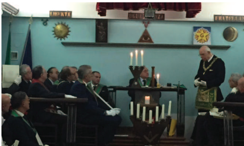
All'Oriente durante i lavori

archiviata. Russo ha tenuto poi a sottolineare il grande impegno dei fratelli nei confronti dei meno abbienti, impegno che si concretizza in gesti importanti di solidarietà. E al termine del suo intervento, ha anche raccontato di aver ritrovato, per caso, alcuni fa, un prezioso opuscolo contenente alcune massime massoniche di straordinaria importanza e