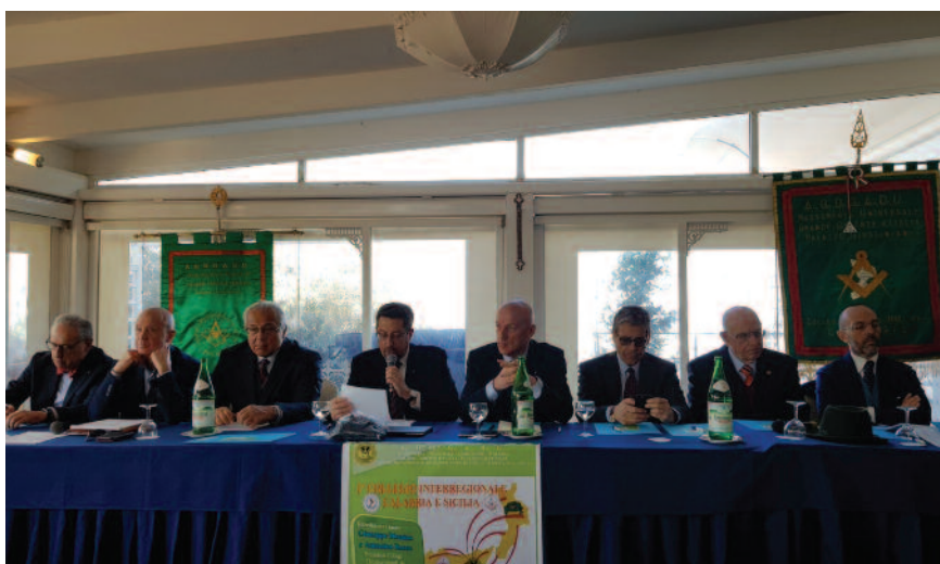
I vertici del due collegi con il Gran Maestro