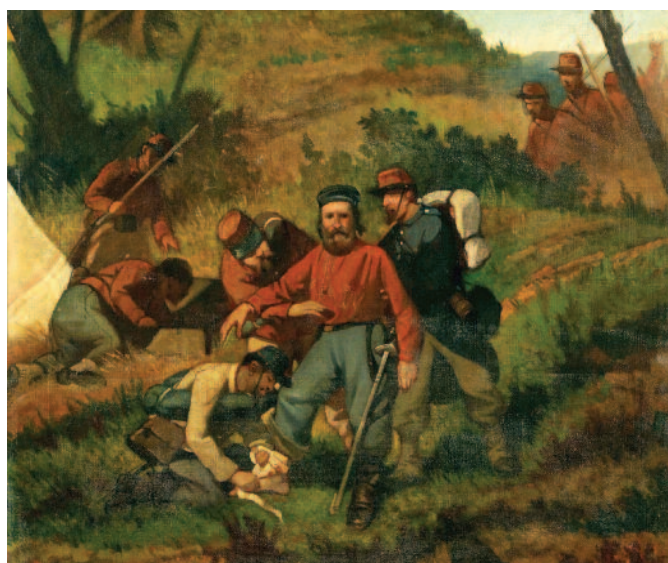
Garibaldi in Aspromonte