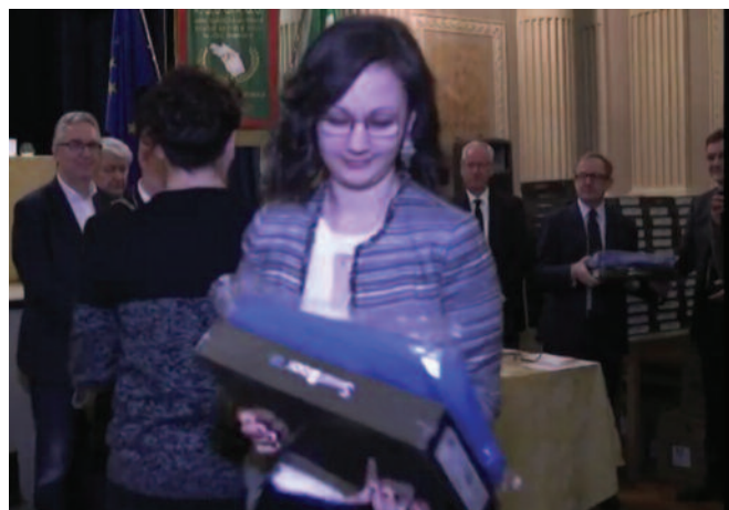
Due momenti della cerimonia di premiazione