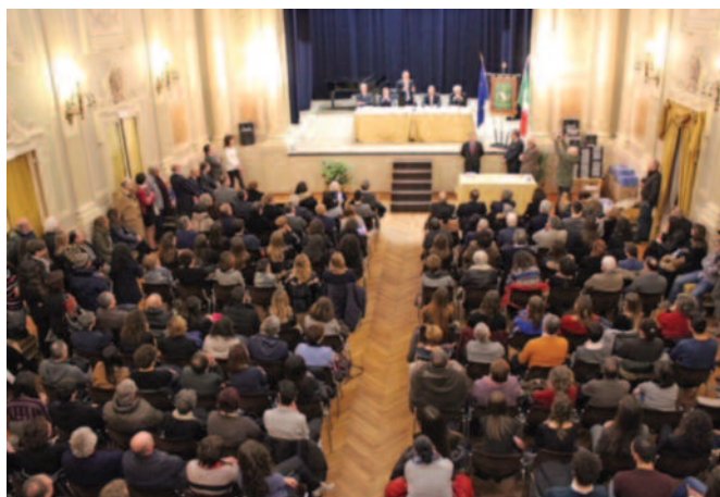
Gremio il salone della Filarmonica di Macerata

situazione particolare. Non è facile studiare mentre la terra trema, con la paura che il tetto sotto il quale vi trovate possa crollare. Voi lo avete fatto, avete continuato a studiare tra una scossa sismica e quella successiva, tra mille gravi problemi e preoccupazioni non solo vostri, della vostra famiglia, ma della comunità intera intorno a voi. Avete avuto coraggio, tanto coraggio. E' per questo che abbiamo chiamato questo premio La Scuola del Coraggio. Voi oggi rappresentate una luce, un faro, su cui investire. Questo piccolo sostegno che vi arriva da noi lo meritate, perché siete riusciti a raggiungere un risultato brillante nonostante la situazione in cui vi trovavate". Bisi ha ricordato l'impegno grande profuso fin da subito a sostegno delle popolazioni terremotate da tutti i fratelli e ha raccontato della richiesta arrivata dai ragazzi di Norcia. Una richiesta che dimostra che quando si è colpiti da gravi tragedia, da cataclismi, oltre che di tende e coperte, c'è bisogno anche di qualcosa che ci faccia tornare il sorriso, la spensieratezza, la gioia di vivere. "Questi ragazzi – ha riferito il Gran Maestro – ci hanno semplicemente chiesto di illuminare un campo di calcio, divenuto