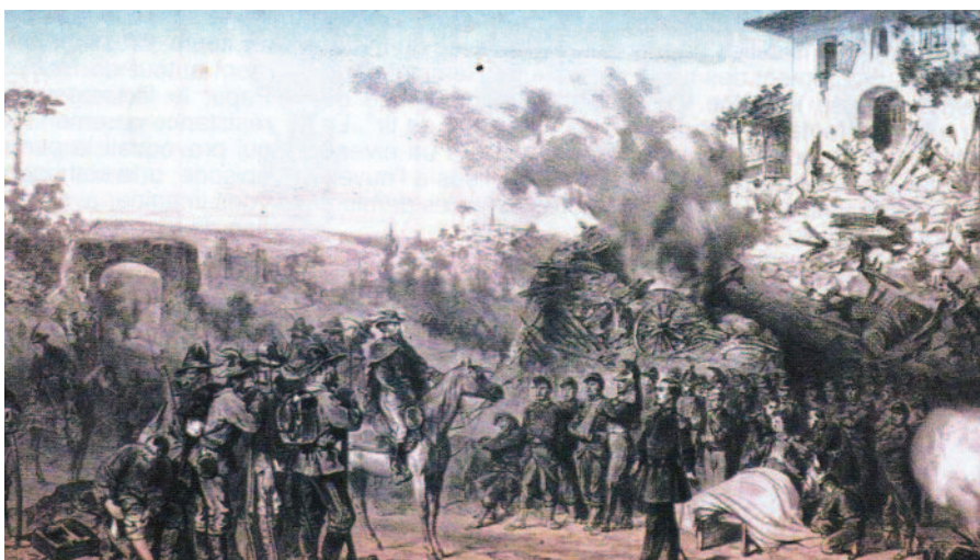
La Battaglia di Monterotondo