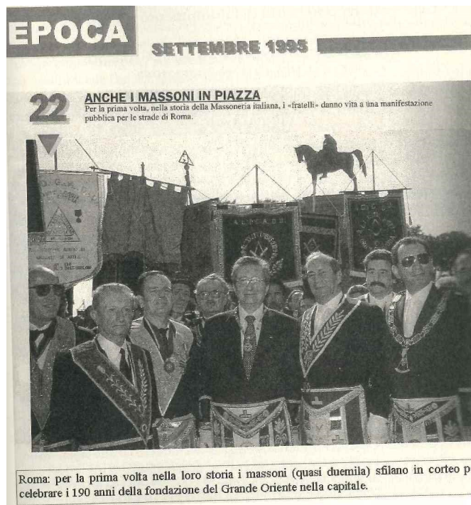
Corteo Massonico per la celebrazione dei 190 anni della fondazione del Grande Oriente d'Italia

L'intero saggio di Virgilio Gaito, per il quale, come egli mirabilmente racconta, l'essere massone è prima di tutto una passione, una fede sincera e profonda, indica nella Cultura la via maestra per perseguire e consolidare l'Etica verso e negli uomini e nelle società. La Cultura come mezzo indefettibile per raggiungere e garantire la libertà, a sua volta garanzia di uguaglianza. La Cultura come elaborazione del pensiero critico che trova la sua scintilla iniziale nel dubbio che induce l'uomo a ricercare se stesso e a non smettere mai di superare i traguardi raggiunti; a interrogarsi, perché solo nel dubbio sta la verità, luce contro gli oscurantismi, le superstizioni e le fin troppo facili creazioni del "nemico" da perseguire ed abbattere. La Cultura, insomma, come intelligenza quale motore del mondo, soffio, carezza divina elargita a pochi eletti, quei pochi la cui vita ha avuto nei secoli e ha ancora il compito di tracciare il solco della Storia dell'umanità.