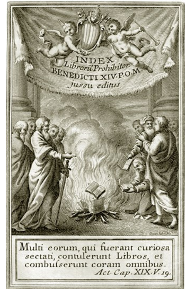
Antiporta dell'Index Librorum Prohibitorum (1790)