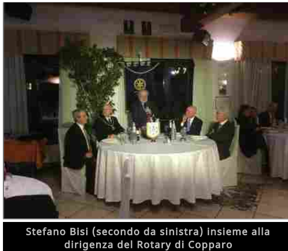
Stefano Bisi (secondo da sinistra) insieme alla dirigenza del Rotary di Copparo

Copparo. Il male del mondo è la massoneria ? "No, è l'impossibilità di comunicare, di dialogare e, di conseguenza, di ascoltare". Questo il pensiero del gran maestro del Grande Oriente d'Italia , Stefano Bisi, ospite del Rotary Club di Copparo per una serata dedicata alla "Massoneria 2.0" , ovvero a come le logge italiane e internazionali si siano adattate ai canali comunicativi del nuovo millennio e quali conseguenze questi hanno sulle tradizioni e sui rituali massonici. Una serata che si è aperta ascoltando in silenzio l'inno francese, come omaggio alle vittime degli attentati di Parigi, e che è proseguita toccando a più riprese i temi internazionali che nelle ultime settimane hanno scosso il mondo.