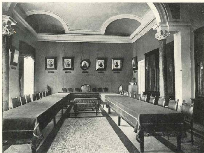
Salone del Consiglio dell'Ordine

El Gran Oriente de Italia está decidido a recuperar el uso del edificio del Palacio Giustiniani, sede actual del Senado de la República. El palacio, adquirido por la Masonería Italiana en 1911, fue sede del Gran Oriente de Italia hasta 1926. Cuando los camisas negras tomaron el poder, la Masonería y su defensa del librepensamiento sufrió la misma persecución que en todas las dictaduras europeas de la época y el edificio fue confiscado. 20 años después, tras el fin de la Segunda Guerra Mundial, el Gran Oriente de Italia retomó su actividad y se abrió un largo proceso para recuperar la sede histórica de la Masonería Italiana .