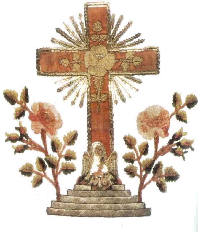
Particolare di grembiule massonico di ispirazione rosacruciana (XVIII secolo)

Seguendo tracce e indizi disseminati nel testo di uno dei romanzi più letti al mondo "Guerra e pace" di Lev Tolstoj, Raffaella Faggionato ci guida in un avvincente percorso a ritroso, alla scoperta di manoscritti, testi ermetici, rituali massonici - un materiale ricchissimo, tuttora sepolto negli archivi di Mosca, che ha nutrito l'immaginazione creativa di Tolstoj nei sette anni di gestazione dell'opera. Aggirandoci nel laboratorio in cui hanno preso forma personaggi divenuti immortali, tra foglietti, appunti, varianti e brutte copie, scopriremo come sono cambiati l'impianto del romanzo e la tecnica narrativa dello scrittore sotto la suggestione del simbolismo massonico e del linguaggio delle scienze ermetiche. Una prospettiva nuova, che apre squarci imprevedibili sull'epoca e sugli uomini che l'hanno abitata e getta una diversa luce sulla controversa questione del rapporto di Tolstoj con il mondo della massoneria russa.