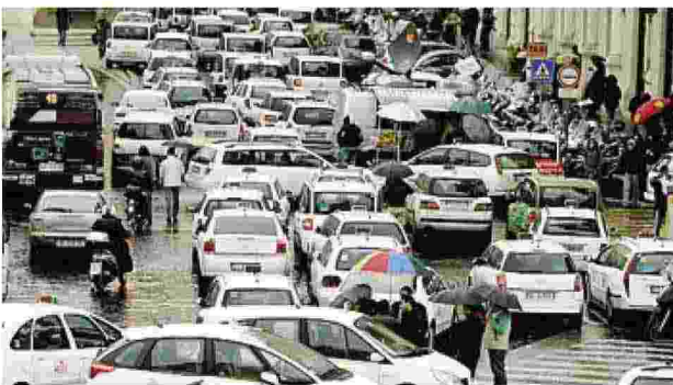
La città bloccata da uno dei tanti scioperi, quello dei taxi.