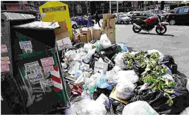
«Romafaschifo»: la protesta è in Rete da anni, e fa più male che bene