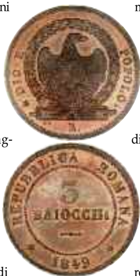
Marco Severini, La Repubblica romana del 1849 , Venezia, Marsilio, 2011