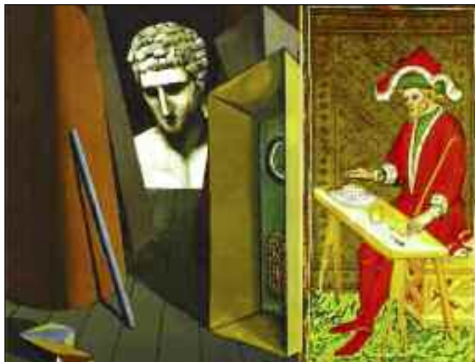
G. de Chirico, Malinconia ermetica , 1919, Musée d'Art Moderne de la Ville, Paris

Nell'intervista lo scrittore rivela che ad accendere il suo interesse per la libera muratoria fu proprio uno dei suoi più cari amici, quello del quale appunto descrive il funerale: "una persona realmente eccezionale". "Così - racconta - ho cominciato ad informarmi, per capire cosa ci trovasse lui in questa istituzione. Credo, alla fine, di averlo capito: come dico in Argento Vivo , 'è un posto dove la parola dell'idraulico conta come quella del professore'. E il mio amico faceva un lavoro umile e dignitoso, ma aveva una testa fuori serie. E più di ogni altra cosa detestava l'ignoranza".