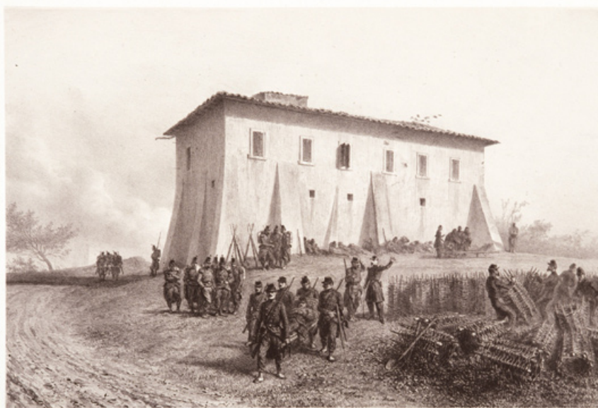
MAISON DES SIX VOULETS VERTS