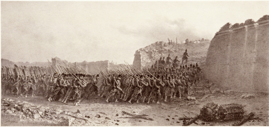
ASSAULT ET PRISE DU BASTION N° 6.

Sur le chef de Bataillon 7 e BRIGADE à la tête de deux Compagnies d'Infanterie de 18 e Ligne d'assaut de capture de la place et d'une colonne de travailleurs. Camp de Rome, 21 Juin 1849.