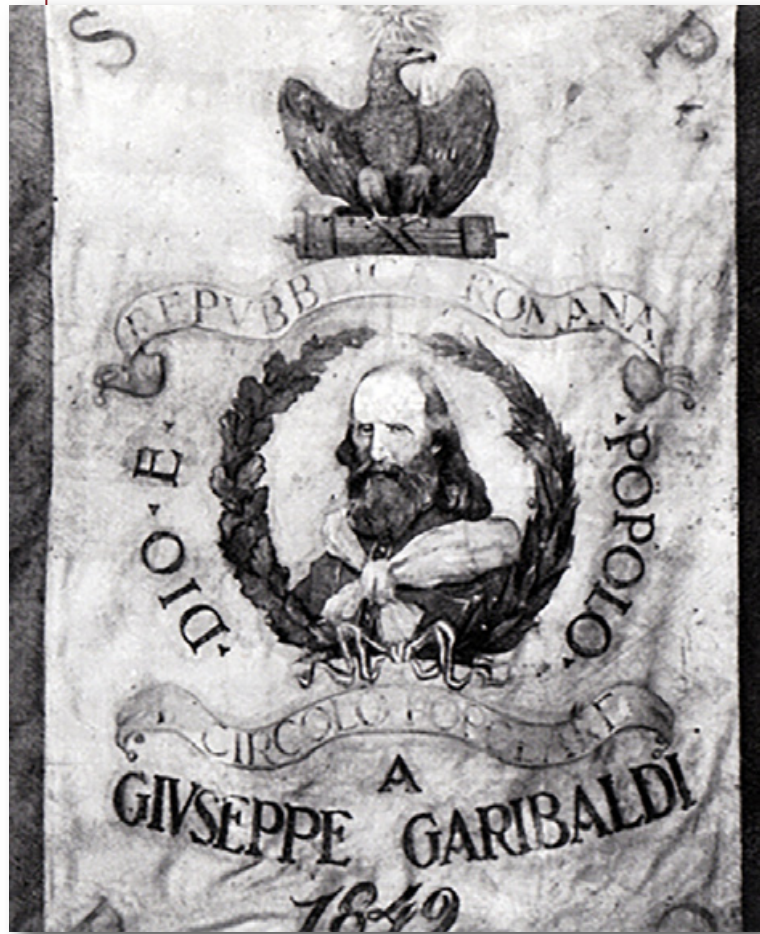
Bandiera della Repubblica romana, 1849 Museo centrale del Risorgimento, Roma