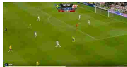
YOUTUBE Ibrahimovic: "Gol rovesciata Cristiano Ronaldo? Meglio il mio da 40 metri"