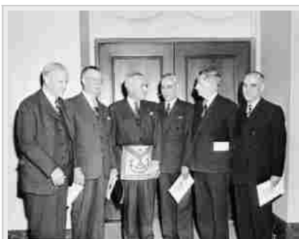
Massoneria a convegno a Rimini. Rapporto del 1945: "Perseguitati da nazi e fascisti". Oggi... Nella foto al centro Harry Truman

Gran Loggia 2018 a Rimini da venerdì 6 a domenica 11 aprile. Conferenza Massoneria in Europa. Il rapporto del 1945 della Masonic Service Association.