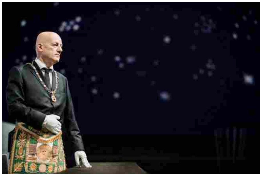
ran Maestro del Grande Oriente d'Italia, Stefano Bisi

REGGIO CALABRIA Alcune scritte sono comparse a Reggio Calabria nella notte sulla porta del palazzo in cui si trova la sede locale del Grande Oriente d'Italia (GoI). A renderlo noto è il Gran Maestro del Grande Oriente d'Italia, Stefano Bisi. «È davvero inquietante ed allarmante. La vicenda dell'inchiesta portata avanti dalla commissione Antimafia e gli articoli di stampa che si sono susseguiti in un clima di caccia alle streghe hanno alimentato una preoccupante deriva che può portare menti deviate e folli a compiere atti ostili ben più gravi mettendo a rischio l'incolumità stessa dei liberi muratori», commenta il Gran Maestro Bisi.