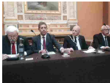
Il convegno sulla massoneria del 11 settembre

"Ci piacerebbe avere di nuovo una sede del Grande Oriente in questa bellissima città dopo oltre trent'anni di assenza - aveva detto Bisi -. Vorremmo colmare questo vuoto e stiamo lavorando per riportare lo spirito liberomuratorio in questa terra che ha dato i natali a uomini di grande anima e intelletto", detto, fatto e così dal 5 marzo "Il nuovo sodalizio massonico sarà dedicato a Quinto Orazio Flacco, il grande poeta latino, nativo di Venosa, alla cui opera si ispirerebbe gran parte del pensiero massonico. L'ultima loggia materana del Grande Oriente, in ordine di tempo, era intitolata a Giambattista Pentasuglia, - si legge sul sito del GOI - l'unico lucano dei Mille, che fu convinto patriota e appassionato libero muratore.