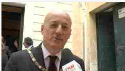
Stefano Bisi – Gran Maestro Grande Oriente d'Italia

"Tolleranza, dialogo e impegno" per affrontare questioni come lavoro e immigrazione. Lo ha detto ieri, a Matera, Stefano Bisi, il Gran Maestro del Grande Oriente d'Italia in occasione del convegno sulla "Massoneria in Basilicata".