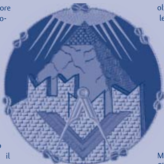
Il nuovo logo della loggia "Meoni-Mazzoni"