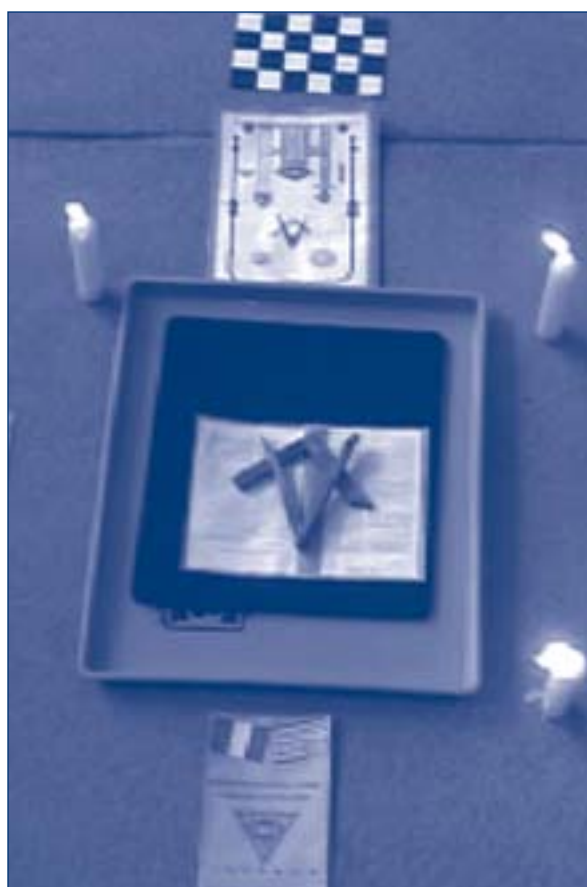
Quadro di loggia allestito a Ground Zero