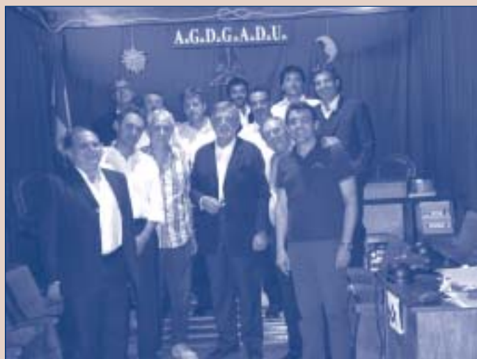
Momento di relax in loggia con il Gran Maestro

Nel suo intervento di chiusura dei lavori, il Gran Maestro ha parlato dei rapporti che devono regolare la vita all'interno dell'Istituzione, basati sul reciproco rispetto e sulla chiarezza. Ha specificato che occorre non superare i limiti del senso civile, per evitare di ridicolizzare il Grande Oriente d'Italia agli occhi "profani". Il Gran Maestro ha ribadito la necessità di non vanificare i risultati ottenuti negli ultimi anni, frutto di un impegno corale che ha coinvolto la Comunione, dal nord, al sud e alle isole. Senza dimenticare il rilancio internazionale del Grande Oriente. Ha detto di confidare nel buon senso dei fratelli, ormai fieri di essere parte di una Massoneria trasparente e vitale che non vuole più tornare indietro.