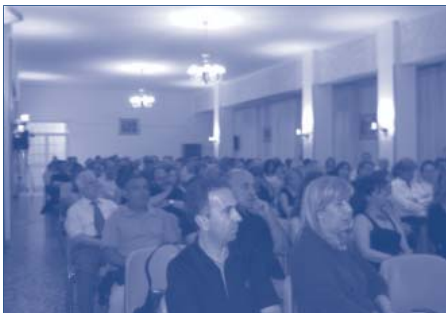
Pubblico in sala

Il pubblico, numerosissimo, ha potuto visitare la base militare prima dell'inizio dei lavori. Il Colonello Giovanni Cappai, Comandante della Base di Teulada, ha dato il benvenuto in sede di convegno dichiarandosi compiaciuto per aver ospitato la manifestazione. Ha infatti spiegato che le forze armate tendono all'avvicinamento della popolazione con le istituzioni militari ben radicate in quel territorio.