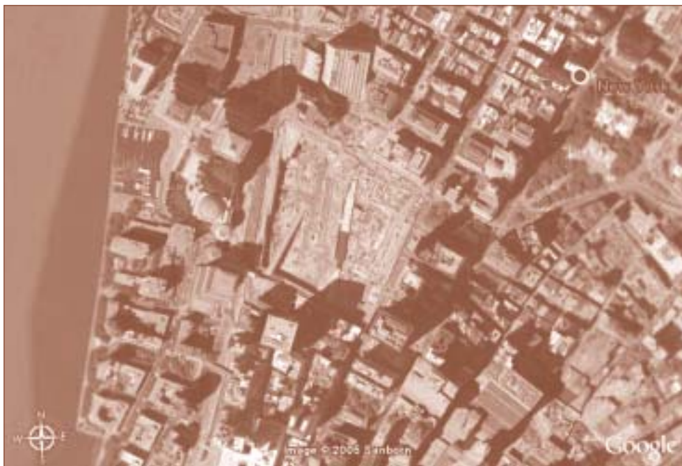
Immagine satellitare di Ground Zero

La tensione si allenta solo quando si ripongono gli attrezzi e i fratelli toscani li donano al tesoro di loggia della "Mazzini". Poi, con calma e dissimulazione, ma capitalizzando interiormente l'intensità emotiva vissuta, i fratelli lentamente riprendono il cammino ad Occidente, verso la profanità. Imboccano scalle, camminano in mezzo agli altri e, infine, si salutano ritualmente ma con discrezione. Nei loro sguardi si legge reciprocamente la gioia di aver condiviso l'intento dei lavori e il senno dei maestri.