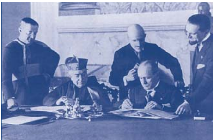
Firma dei Patti Lateranensi

Così, a distanza di alcuni secoli, dobbiamo ammettere che non suonano talmente anacronistiche alcune osservazioni di Machiavelli quando sferzava i principi che cercano di appoggiarsi strumentalmente a Dio e non alla propria virtù, e non dava tregua a quei religiosi "che pretendono di fare della politica solo facendo della religione, e viceversa" ammonendoli che in questo modo essi non riescono a nient'altro che "a corrompere la religione e a fare della pessima politica".