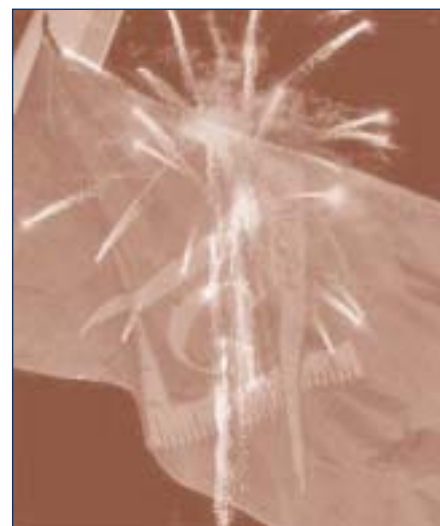
La bandiera massonica sulla motonave. Nello sfondo i fuochi d'artificio