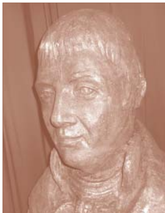
Il busto donato al Comune dalla loggia algherese