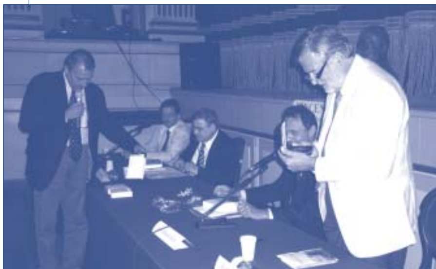
Il Gran Maestro riceve una medaglia dal sindaco di La Maddalena

Il Gran Maestro ha chiuso il convegno evidenziando “le doti morali di quest’eroe della storia sarda”, “un uomo – ha precisato – di cui non esistono attestazioni della sua appartenenza massonica, ma che visse in linea con i valori della Libera Muratoria”. “Non volle mai tradire il suo ideale – ha aggiunto – che, sebbene scomodo, non ebbe paura di rinnegare, nemmeno davanti alla condanna a morte. Fu un uomo che per tenere alti i suoi principi rinunciò agli agi, alle ricchezze che il suo status sociale gli avrebbe consentito e morì povero. Ma mai dimenticato”. “Si fatica a proiettare nel nostro tempo questo modo d’essere – ha detto il Gran Maestro al termine – e a paragonare questi impulsi a quelli del mondo attuale, così privi di slanci ideali, estranei a quelle utopie che permettono di vivere nella speranza. Oggi si è solo pronti a vendersi al miglior offerente e non si conoscono più figure pronte all’abnegazione di fronte ai pericoli e alle difficoltà. Pensiamo anche ai tanti massoni, in Italia e nel mondo, che si sono distinti, in qualsiasi campo, solo per il raggiungimento di un ideale. Sono la ricchezza di un mondo che si è aperto al progresso e alla democrazia. Ma quella, possiamo affermare, è tutta un’altra storia”.