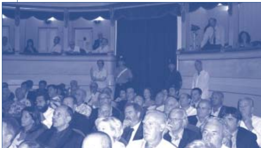
Pubblico al Teatro Civico