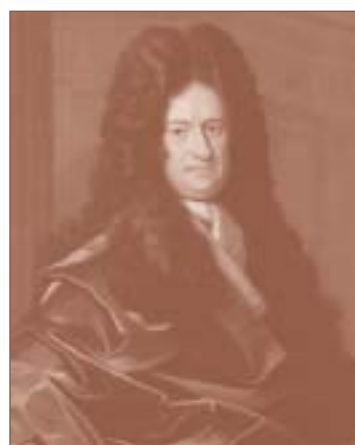
Gottfried Wilhelm Leibniz (1646 - 1716)