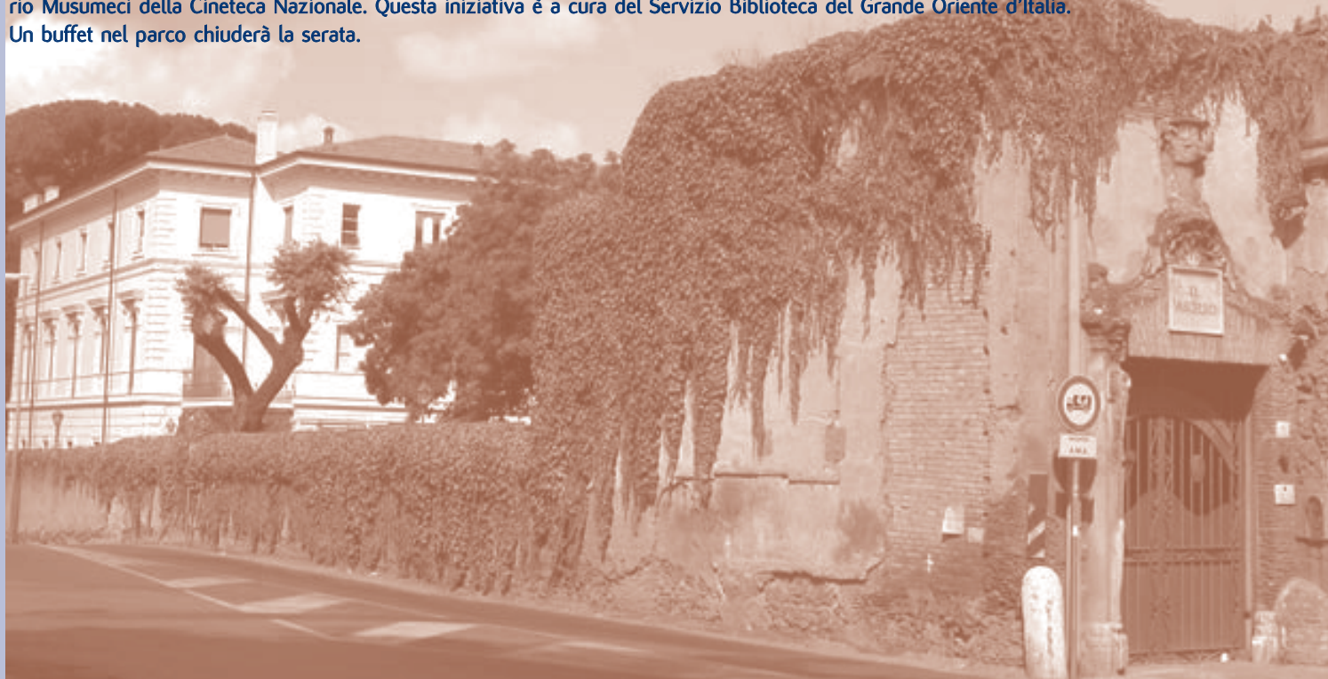
Esterno di Villa 'Il Vascello'