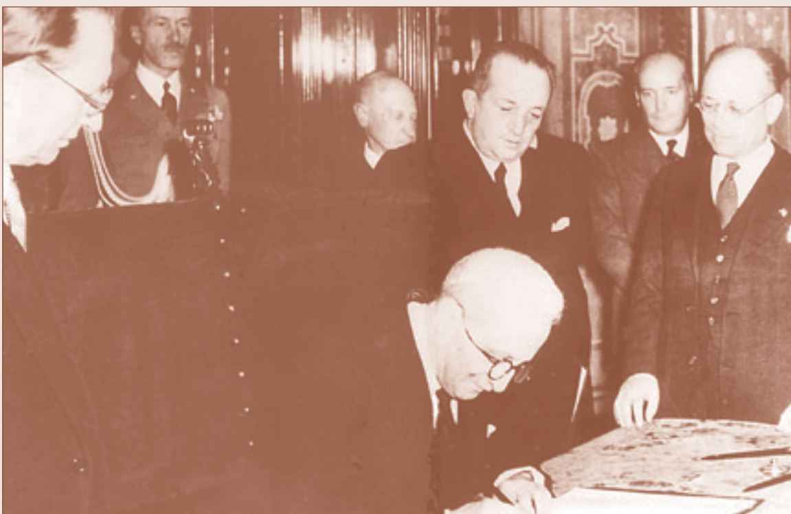
Ancora una foto della firma dell'atto di promulgazione della Costituzione della Repubblica Italia da parte di Enrico De Nicola