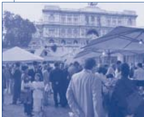
L'aperitivo prima dell'imbarco

Originale iniziativa del Collegio del Lazio che il 30 maggio ha tenuto nella capitale la seconda edizione della festa della circoscrizione con una mini-crociera sul Tevere.