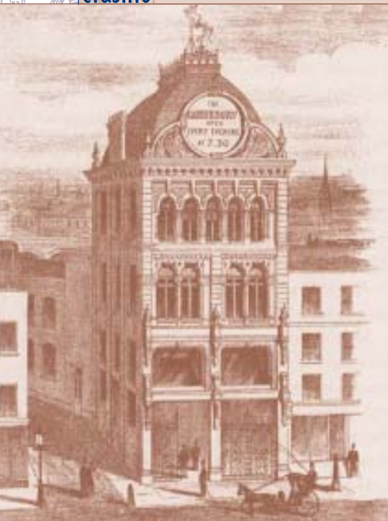
La facciata del "Canterbury Hall", uno dei primi Music Hall londinesi