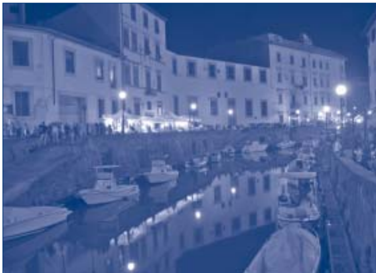
Il quartiere La Venezia in una delle passate edizioni della rassegna