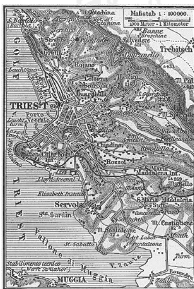
Mappa austriaca di Trieste del 1888

La nascita della Trieste moderna, del suo spirito, del suo essere, del 'suo quid consistam', risale al quindicennio dal 1815 al 1830. Ridotta dalle guerre e dalla occupazione napoleonica a poco più di 3.000 abitanti, e lentamente ripopolatasi sino a quanti vi vivevano prima della rivoluzione francese (30.000), la città, a seguito di una straordinaria combinazione di circostanze e avvenimenti, vide moltiplicarsi i suoi abitanti di quasi