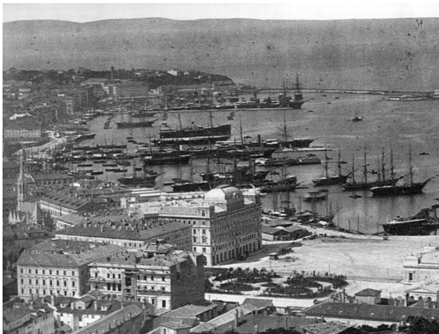
Trieste nel 1885

Su questo filone, ispirato e guidato sulla spoglie della carboneria e della mazziniana Giovane Italia, del "comitato segreto tergestino", interamente massonica (Hermet, Hortis, Nobile, Vidacovich; Costantini, Maehlig) si innesta l'irredentismo del nostro Imbriani, movimento guidato da principi massonici di libertà, fratellanza e uguaglianza che vedeva nella unione alla Italia (i cui ideali simboli erano Garibaldi, Cavour, Mazzini, massoni o molto vicini alla massoneria perseguitata in Austria) indicando la via da perseguire nel raggiungimento della libertà da ogni discriminazione e differenziazione. Trieste quindi ha voluto essere italiana, e lo ha voluto soprattutto nel pensiero e nelle esternazioni dei suoi spiriti migliori, massoni tutti o quasi. La unificazione dal 1918 che nei versi